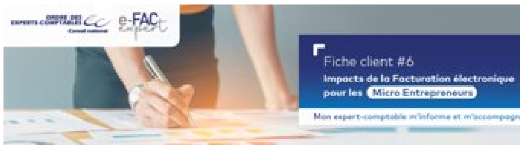
11 fiches info clients par métier ou secteur d'activité