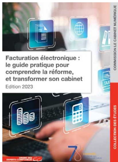
Le guide pratique de la Facturation électronique