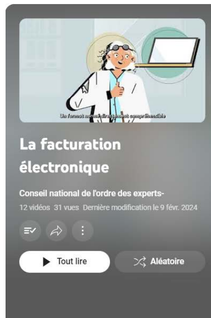
12 vidéos de 3mn pour tout comprendre sur la facturation électronique